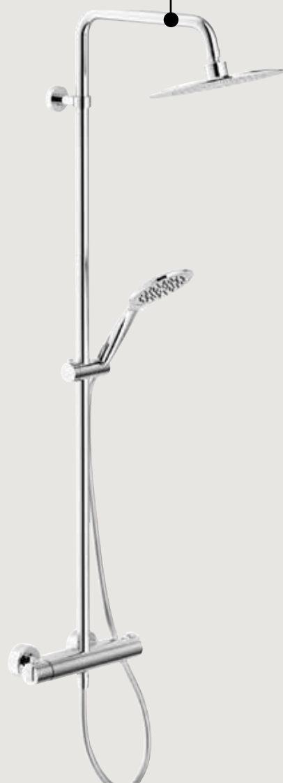
Colonne de douche Look 230