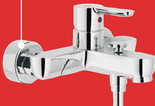
Mitigeur Baignoire Look 110