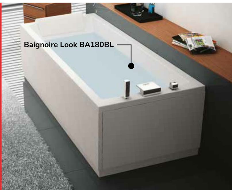
Baignoire Look BA180BL