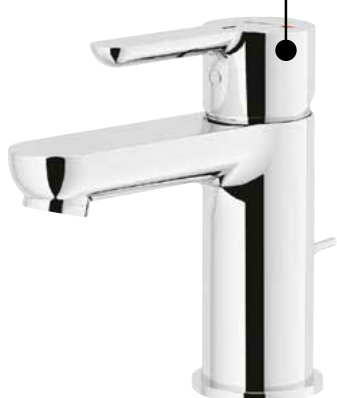
Mitigeur vasque Look 118